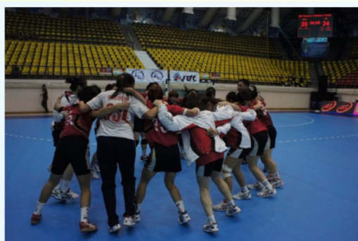
隊員們賽後擁抱慶祝