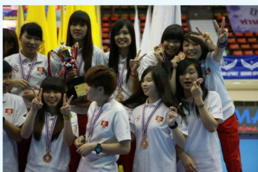
隊員們在頒獎禮上難掩興奮心情