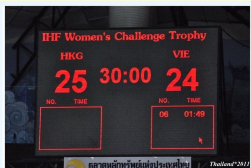
香港隊憑最後一分鐘的入球險勝越南隊