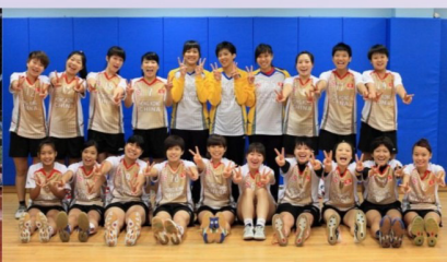
香港國際手球錦標賽