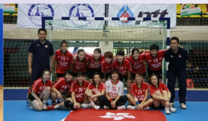
往泰國參加國際女子手球挑戰盃