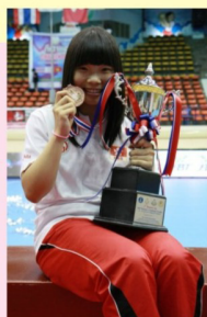
國際女子手球 挑戰盃季軍